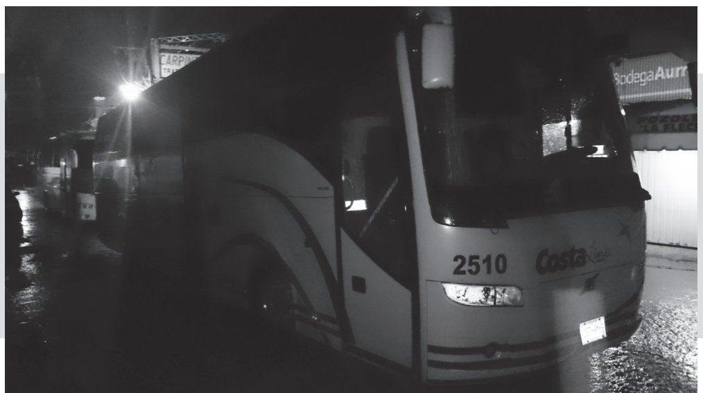
Crédito/ Semanario Nuestro Tiempo.

* Fuente original: http://www.avn.info.ve/node/401703